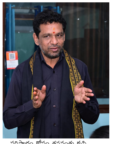
పరిష్కారం కోసం తనవంతు కృషి చేస్తానని అన్నారు. తెలంగాణ లో ప్రైవేటు ఉపాధ్యాయుల సమస్యలను పరిష్కరించేలా చొరవ చూపుతామని, వివిధ రంగాల్లో పనిచేస్తున్న గెస్ట్ ఫ్యాక్టరీల సమస్యలను సిఎం రేవంత్ రెడ్డి దృష్టికి తీసు కెళ్లినట్లు ఆయన తెలిపారు. ఇటీవలి కాలంలో నియామక నా మైన ఉద్యోగులు కోరుకుంటున్న %టూరా% పథకానికే కార్యాచరణ రూపొందించేలా కృషి చేస్తానని తెలిపారు.. విద్యార్థుల సమస్యల పరిష్కారంతో పాటు చేయాలనే దృఢ సంకల్పంతో ఎమ్మెల్యేగా పోటీ చేస్తున్నట్లు, వచ్చే ఎమ్మెల్యే ఎన్నికల్లో తన ను ఆశీర్వదించి అవకాశం కల్పించాలని ఆయన కోరారు.