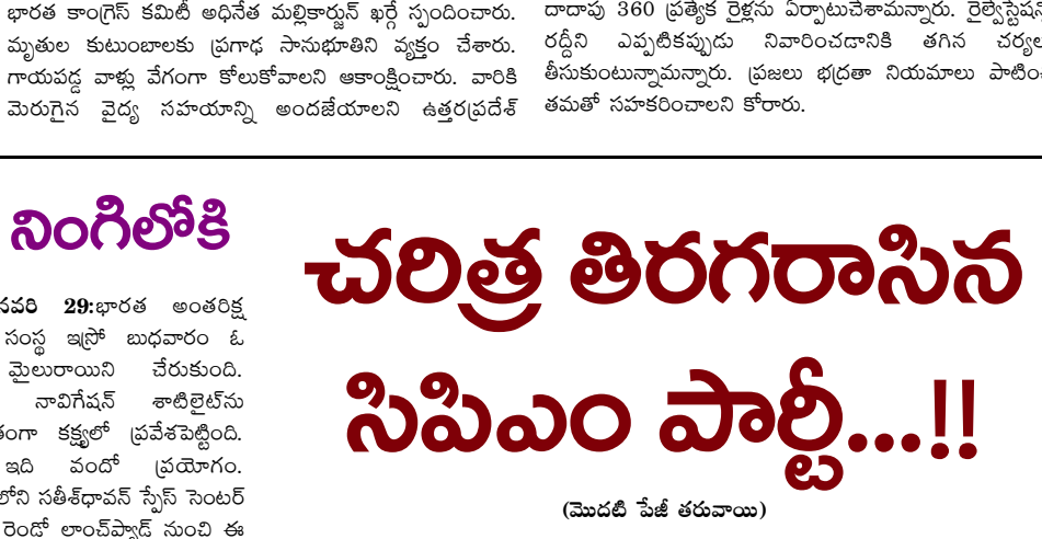
(మొదటి పేజీ తరువాయి)

నిర్వహిస్తూ, అలాగే 1997లో సిపిఎం (ఎం) రాష్ట్ర కమిటీ ఎన్నిక, ప్రస్తుతం రాష్ట్ర అధ్యక్ష బాధ్యతలో ఉన్నారు. రంగారెడ్డి జిల్లా 2022లో జరిగిన సిపిఎం పార్టీ రాష్ట్ర మూడో మహాసభలో కార్యదర్శివర్గ సభ్యులుగా ఎన్నికయ్యారు. అలాగే కుల వివక్షకు వ్యతిరేకంగా, దళితుల హక్కు కోసం పొలిటి బ్యూరో సభ్యులు బివి. రాఘవులతో కలిసి సైకిల్ యాత్ర చేపట్టారు. వెన్నీ నేతృత్వంలో కెవిపిఎస్ పోరాటాల ఫలితంగా రాష్ట్రంలో జస్టిస్ ఉన్న యొక్క మిషన్ ఏర్పాటు చేశారు. అలాగే కెవిపిఎస్ వదళ్ళ పోరాటం ఫలితంగా రాష్ట్రంలో ఎస్సీ, ఎస్టీ సబ్ ప్లాన్ అమలు చేశారు. ఇది దేశంలోనే తెలంగాణలో తొలిసారి అమలైంది. సమగ్ర అభివృద్ధి కోసం సిపిఎం (ఎం) అధ్యక్షులతో చేపట్టిన పాదయాత్ర బృందంలో జాన్ వెన్నీ సభ్యులుగా విధులు నిర్వహించారు. ఇప్పుడున్న పరిస్థితులను బట్టి సిపిఎం అగ్రనాయకత్వం నేడు ఆయన పనితీరును గమనించి నాయకత్వ హగ్గలను అప్పగించారు. జాన్ వెన్నీ నియమిస్తేనే తెలుగు రాష్ట్రాలలో పార్టీ మనుగడ కొనసాగే పరిస్థితి ఉందని ఆలోచించి అగ్రనాయకత్వం బాధ్యతలను అప్ప చెప్పారని సిపిఎం నాయకులు బహిరంగంగా చర్చించుకుంటున్నారు.