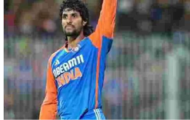
22 ఏళ్ల 82 రోజులు. ఒకవేళ అతడు త్వరలో టాప్ ర్యాంక్కు చేరుకుంటే పొట్టి ఫార్మాట్ ర్యాంక్ కు అతిపెద్ద వయసులో ఆ ఫీట్ నమోదు చేసిన బ్యాటర్ గా వరల్డ్ రికార్డ్ క్రియేట్ అవుతుంది. ఇది తెలిసిన నెటిజన్లు.. ఆజామూ నీ రికార్డుకు మూడింది అంటూ బాబర్ ను డ్రోట్ చేస్తున్నారు.