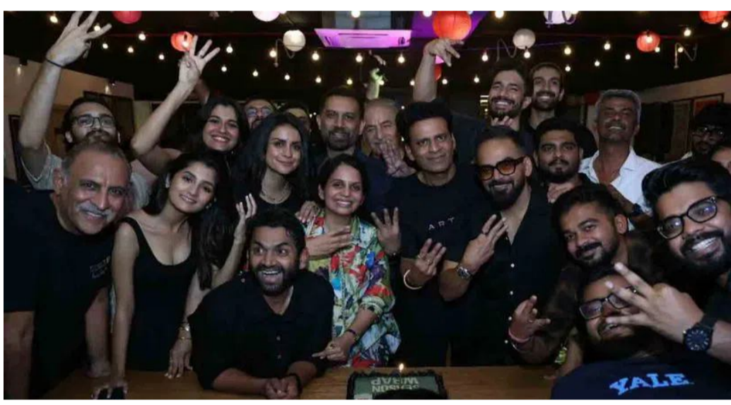
పెరిగినా సవాళ్లు వెంటాడుతూనే ఉంటాయి. అయితే ఈ సవాళ్లను శ్రీకాంత్ ఎలా సీజన్ 3 వచ్చేవరకు ఆగాల్సిందే.

ఓటీటీ ప్రియులకు పరిచయం అక్కర్లేని వెబ్ సిరీస్ లలో 'ది ఫ్యామిలీ మ్యాన్' ఒకటి. మనోజ్ బాజ్ పాయ్, ప్రియమణి లీడ్ రోల్ లో నటించిన ఈ సిరీస్ రెండు భాగాలుగా వచ్చి అమెజాన్ ప్రైమ్ లో రికార్డులు సమోదరు చేసింది. పై, డ్రిల్లర్ గా వచ్చిన ఈ సిరీస్ ను దర్శకత్వం రాజ్ %౬% డీకే తెరకెక్కించారు. ఈ వెబ్ సిరీస్ ఘాటింగ్ గత ఏడాది మేలో ప్రారంభమైన విషయం తెలిసిందే. తాజాగా ఈ సిరీస్ ఘాటింగ్ కంప్లీట్ చేసుకున్నట్లు రాజ్ డీకే ఎక్స్ వేదికగా వెల్లడించారు. ఈ సందర్భంగా ఫ్యామిలీ మ్యాన్ టీమ్ తో దిగిన ఫోటోలను పంచుకున్నారు. ఈ ఫోటోలలో సమంత కూడా ఉండడం విశేషం. ఫస్ట్ సీజన్ డెవలప్ మెంట్ లో రాగా.. సెకండ్ సీజన్ శ్రీలంక రెబల్ బ్యాక్ డ్రాఫ్ట్ లో వచ్చి హిట్ అందుకుంది. ఇక సెకండ్ సీజన్ లో సమంత లీడ్ రోల్ లో నటించడం విశేషం. అయితే 'ది ఫ్యామిలీ మ్యాన్ 2' ఎక్కడైతే పూర్తి అక్కడి నుంచే 'ది ఫ్యామిలీ మ్యాన్ 3' మొదలవుతుందని మేకర్స్ తెలిపారు. సీజన్ 3 ఎక్కువగా నార్త్ ఈస్ట్ ఇండియాలో బ్యాక్ డ్రాఫ్ట్ లో రాబోతున్నట్లు ప్రకటించింది. శ్రీకాంత్ తివారి (మనోజ్ బాజ్ పాయ్) పిల్లలు పెద్దవాళ్లు అవుతారు. ఆయనకు వయసు