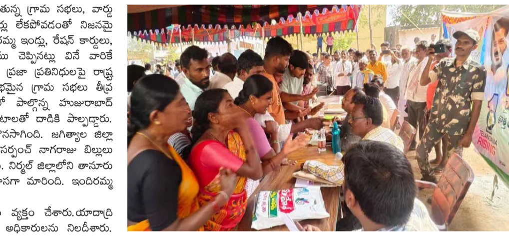
పెట్టుకుంది. మాకు సంబంధం లేదని అధికారులు చేతులు దులుపుతున్నారు. నిజామాబాద్ జిల్లా వేల్పూర్ మండలం నడుమ గ్రామంలో అధికారులతో గ్రామ సభలో గ్రామస్థులు వాగ్వాదానికి దిగారు. మొత్తంగా తీవ్ర నిరసనల నడుమ గ్రామ సభలు కొనసాగుతున్నాయి.