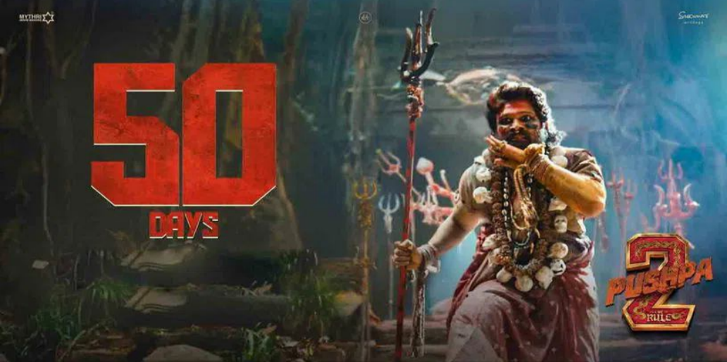
బకాస్ స్టార్ అల్లు అర్జున్ నటించిన ఆల్ టైం బ్లాక్ బస్టర్ చిత్రం పుష్ప 2 ది రూల్ నేటికి 50 రోజులు పూర్తి చేసుకుంది. పుష్ప పార్ట్ 1 సినిమాకి సీక్వెల్ గా వచ్చిన ఈ సినిమాకు సుకుమార్ దర్శకత్వం వహించాడు. డిసెంబర్

05న ప్రేక్షకుల ముందుకు వచ్చిన ఈ చిత్రం విడుదల రోజు నుంచే అటు రికార్డులతో పాటు వలు వివాదాల్లో ఇరుక్కుంది. ఈ మూవీ డెసిఫ్ట్ షో రోజు సంధ్య థియేటర్ వద్ద మహిళ వృత్తి చెందడంతో ఈ ఘటనకు సంబంధించి అల్లు అర్జున్ ఆరెస్ట్ కూడా అయ్యారు. అయితే ఇన్ని వివాదాల మధ్య ఈ చిత్రం తాజాగా 50 రోజులు కంప్లీట్ చేసుకుంది. ఈ క్రమంలోనే పలు రికార్డులను సైతం సమోదరు చేసింది. ఇక పుష్ప సమోదరు చేసిన రికార్డులు చూసుకుంటే.. కేవలం 32 రోజుల్లోనే ప్రపంచవ్యాప్తంగా రూ.1831 కోట్లు వసూలు చేసింది. ఇందులో రూ.900 కోట్లు కేవలం హిందీ బెల్ట్ నుంచి రావడమే విశేషం. ఇవే కాకుండా.. ఫస్ట్ రోజే.. రూ.294 కోట్లు వసూళ్లను రాబట్టింది. ఇక ఈ చిత్రం 50 రోజులు పూర్తి చేసుకున్న సందర్భంగా చిత్రబృందం ప్రత్యేక మీడియాను పంచుకుంది. ఓటీటీ అప్ డేట్ మెంట్ కోసం ఎదురుచూపులు ఇదిలావుంటే ఈ సినిమా ఎప్పుడు ఓటీటీలోకి వస్తుందా ఎప్పుడెప్పుడు చూద్దామా అని ఓటీటీ ప్రేక్షకులు తెగ ఎదురుచూస్తున్నారు. ఈ క్రమంలోనే ఈ చిత్రం ఓటీటీకి సంబంధించి ఒక వార్త సోషల్ మీడియాలో తెగ వైరల్ అవుతుంది. తాజా సమాచారం ప్రకారం.