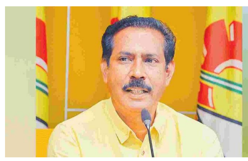
లేని వైసీపీ నేతలు చెప్పినట్లు బలమైన టీడీపీ నాయకులు వింటారా? అంటే.. ప్రతిపక్షం అధికార పక్షాన్ని ఆడిస్తోందా? అనేది ప్రశ్నలుగా మిగిలాయి. అంతేకాదు.. అధికార పార్టీ ఎమ్మెల్యేలు మరీ అంత బలహీనంగా ఉన్నారా? అనే ప్రశ్నలు తెరమీదికి వచ్చాయి.