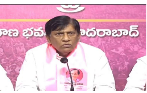
చెందిన బీహార్ సీఎం నితిష్ కుమార్ కూడా యూజీసీ ప్రతిపాదనల వ్యతిరేకించారు. ఆంధ్రప్రదేశ్ ముఖ్యమంత్రి

హైదరాబాద్ : యూనివర్సిటీ గ్రాంటీ కమిషన్ కొత్త నిబంధనలపై అనేక రాష్ట్రాలు నిరసన తెలుపుతున్నాయని బీఆర్ఎస్ సీనియర్ నేత, మాజీ ఎంపీ వినోద్ కుమార్ తెలిపారు. ఈ క్రమంలో తెలంగాణ అసెంబ్లీలో కూడా యూజీసీ ముసాయిదాకు వ్యతిరేకంగా తీర్మానం చేయాలని సీఎం రేవంత్ రెడ్డికి వినోద్ కుమార్ డిమాండ్ చేశారు. ఇవాళ వినోద్ కుమార్ తెలంగాణ భవన్ లో మీడియాతో మాట్లాడుతూ.. తమిళనాడు అసెంబ్లీ యూజీసీ నిబంధనలకు వ్యతిరేకంగా తీర్మానం చేసి వంపింది. ఫెడరల్ స్పూర్తిని మంబు గలుపుతున్నారని తమిళనాడు సీఎం స్టాలిన్ కేంద్రప్రభుత్వంపై ముడిపడ్డారు. కేరళ సీఎం కూడా యూజీసీ ప్రతిపాదనలను వ్యతిరేకించారు. ఎన్డీ భాగస్వామ్య పక్షమైనప్పటికీ జేడీయూకి