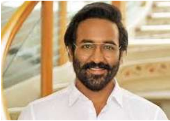
తెలుగు చిత్ర పరిశ్రమలో విలక్షణ నటుడు మంచు మోహన్ బాబుకి ప్రత్యేకమైన స్థానం ఉంటుంది. హీరోగా, విలన్ గా, కామెడీ విలన్ గా, కమెడియన్ గా, క్యారక్టర్ ఆర్టిస్టుగా ఎన్నో విభిన్నమైన పాత్రల్లో సిని అభిమానులను అలరించారు. 565కి

పైగా చిత్రాల్లో తన విలక్షణ నటనతో, డైలాగ్ డెలివరీతో మెప్పించారు. అందుకే ఫ్యాన్స్ ఆయన్ను 'డైలాగ్ కింగ్' అని, 'కలెక్షన్ కింగ్' అని పిలుచుకుంటున్నారు. నటుడిగానే కాకుండా నిర్మాతగానూ రాణించారు. సిని ఇండస్ట్రీలో 50 ఏళ్లు ప్రస్థానాన్ని పూర్తి చేసుకున్న మోహన్ బాబు బయోపిక్ తీయాలని ఆయన పెద్ద కొడుకు మంచు విష్ణు ఆశ పడుతున్నారు. 'కన్నప్ప' మూవీ ప్రమోషన్స్ లో భాగంగా మంచు విష్ణు తాజాగా ఇచ్చిన ఓ ఇంటర్వ్యూలో తన తండ్రి మోహన్ బాబు బయోపిక్ గురించి ఇంట్రెస్టింగ్ కామెంట్స్ చేశారు. ఇప్పటికిప్పుడు తన తండ్రి బయోపిక్ తీయాలనే ఆలోచన లేదని, కానీ భవిష్యత్ లో తీసే అవకాశం ఉందని తెలిపారు. కానీ అందులో తాను హీరోగా నటించనని, ఎందుకంటే తన తండ్రి పాత్రకి పూర్తి స్థాయిలో న్యాయం చేయలేనని అన్నారు. మోహన్ బాబు బయోపిక్ తీస్తే మాత్రం కచ్చితంగా తమిళ హీరో సూర్యతో తీస్తానని మంచు విష్ణు చెప్పారు. తన బ్యానర్ లో సొంత నిర్మాణంలో ఆ బయోపిక్ రూపొందిస్తానని పేర్కొన్నారు. ఇక హీరో సూర్యతోనూ మంచు ఫ్యామిలీకి సత్సంబంధాలు ఉన్నాయి. గతంలో సూర్య హెమాన్ బ్యానర్ లో తెరకెక్కిన 'అకాశం నీ హద్దురా' సినిమాలో మోహన్ బాబు కీలక పాత్ర పోషించారు. ఆ సమయంలో ఇరువురు చాలా సార్లు కలుసుకున్నారు. సూర్య సైతం మోహన్ బాబు అంటే తనకు చాలా గౌరవం ఉందని పలు సందర్భాల్లో అన్నారు. మరి ఫ్యూచర్ లో మోహన్ బాబు బయోపిక్ తీయాలని ఆనుకుంటే, సూర్య లీడ్ రోల్ లో నటించానికి అంగీకరిస్తారేమో చూడాలి.