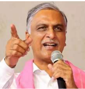
హైదరాబాద్, 21 (తెలుగు వెలుగు): అందరికీ రుణమాఫీ చేసినట్లు అందమైన కట్టుకథను ప్రచారం చేస్తున్న ముఖ్యమంత్రి రేవంత్ రెడ్డిని ప్రజలు నిలదీస్తున్నారని బీఆర్ఎస్ ఎమ్మెల్యే హరీష్ రావు విమర్శలు చేశారు. ఇప్పటికీ చాలా మంది రైతులకు రుణమాఫీ కాలేదని, రైతుల నుంచి తీవ్ర నిరసనలు వ్యక్తమవుతున్నాయని హరీష్ రావు తెలిపారు. గాంధీ భవన్ వద్ద ధర్నాకు దిగిన రైతు విషయంలో హరీష్ రావు స్పందించారు. అందరికీ రుణమాఫీ చేసినట్లు అందమైన కట్టుకథను ప్రచారం చేస్తున్న ముఖ్యమంత్రి రేవంత్ రెడ్డి గారు.. మిమ్మల్ని నిలదీసేందుకు తుంగతుర్తి నుంచి గాంధీ భవన్ దాకా

వచ్చిన రైతు తోట యాదగిరి గారికి ఏం సమాధానం చెబుతారని నిలదీశారు. మీరొచ్చిన ఆరు గ్యారంటీలు ఎన్నికల గారడీనేనే, 420 హామీలు అమలు పట్టి బూటకమేనని తెలంగాణ ప్రజలు తక్కువ సమయంలోనే తెలుసుకున్నారు. మిమ్మల్ని నిలదీసేందుకు ఒక్కొక్కరిగా గాంధీ భవన్ కు చేరకముందే పాపపరిహారం చేసుకోండి. రైతులు, మహిళలకు, విద్యార్థులకు, వృద్ధులకు, ఉద్యోగులకు.. అన్ని వర్గాలకు ఇచ్చిన హామీలు నిలబెట్టుకోండి అని రేవంత్ రెడ్డికి హరీష్ రావు సూచించారు. ఈరోజు గాంధీ భవన్ దాకా వచ్చిన వారు, రేపొ మోపా మి జూబ్లీహిల్స్ ప్యాలెస్ దాక వస్తారు. ప్యాలెస్ పాలన వదిలి ప్రజా పాలన కొనసాగించు. ఏడు పదుల వయస్సులో రుణమాఫీ కోసం బ్యాంకుల చుట్టూ తిరిగిండు, అధికారులను వేడుకున్నరు. అయినా వెనకబారు వేయకుండా గాంధీ భవన్ దాకా వచ్చి పోరాటం చేస్తున్న రైతు యాదగిరి పట్టుదలకు అభినందనలు. ఇదే సూర్యోత్ అన్ని వర్గాల ప్రజలు మోసపూరిత కాంగ్రెస్ ప్రభుత్వంపై పోరాటం చేయాలని, హామీలు అమలు చేసే దాకా కొట్లాడాలని బీఆర్ఎస్ పక్షాన పిలుపునిస్తున్నాం అని హరీష్ రావు పేర్కొన్నారు.