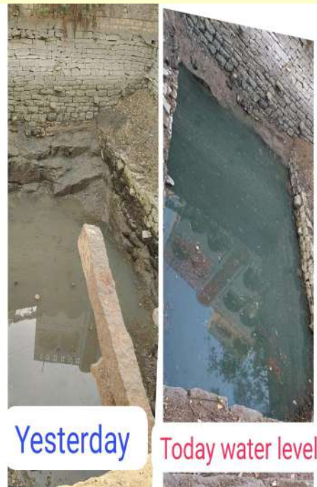
Yesterday Today water level