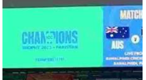
ఆస్ట్రేలియా-సౌతాఫ్రికా.. ప్రస్తుత క్రికెట్ లో రెండు బదా జట్లు. చిరకాల ప్రత్యర్థులు కాకపోయినా ఈ టీమ్స్ బరిలోకి దిగిన ప్రతిసారీ కొడమనుంచోల్లా కొట్టుకుంటాయి. క్వాలిటీ క్రికెట్ అడియోస్ ను పులిగా ఎంటర్టైన్ చేస్తుంటాయి. అందుకే ఆసీస్-ప్రాచీన్ ఫైట్ కోసం అందరూ ఎగ్జైటింగ్ గా ఎదురు చూస్తుంటారు. ఛాంపియన్స్ ట్రోఫీలో ఈ రెండు జట్ల మధ్య మ్యాచ్ అనగానే హ్యూజ్ బజ్ నెలకొంది. మ్యాచ్ చూసి ఎంజాయ్ చేద్దామని ఫ్యాన్స్ రెడీ అయిపోయారు. కానీ ఏం లాభం? టాస్ కూడా పడకుండానే మ్యాచ్ రద్దయింది. అసలేం జరిగిందో ఇప్పుడు చూద్దాం.. వదలని వరుణుడు ఆస్ట్రేలియా-సౌతాఫ్రికా మధ్య ఇవాళ జరగాల్సిన గ్రూప్ బీ మ్యాచ్ రద్దయింది. ఎడతెరిపి లేకుండా కురుస్తున్న వానల కారణంగా మ్యాచ్ ను రద్దు చేస్తున్నట్లు అంపైర్లు అనౌన్స్ చేశారు. ఒక్క బంతి కాదు కదా.. కనీసం టాస్ కూడా పడకుండానే మ్యాచ్ రద్దవడంతో ఆభిమానులు నిరాశలో మునిగిపోయారు. మ్యాచ్ రద్దుతో రెండు జట్లకు చెరో పాయింట్ ఇచ్చారు. మొదట వాన తగ్గిలా కనిపించడంతో 20 ఓవర్ల చొప్పున ఆడించే చాన్స్ ఉందని వినిపించింది. కానీ చివరకు మ్యాచ్ ను రద్దు చేశారు.