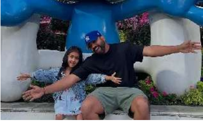
ఛాంపియన్స్ ట్రోఫీలో భారత్ దూకుడు కంటిన్యూ అవుతోంది. ఇప్పటికే ఆడిన రెండు మ్యాచ్లలో జయభేరి మోగింది. రెండు మ్యాచ్లలో రెండు విజయాలతో నాలుగు పాయింట్లను తన ఖాతాలో వేసుకుంది. గ్రూప్ విలో రెండో స్థానంలో నిలిచింది. సెమీ ఫైనల్స్ కు అర్హత సాధించింది. ఈ గ్రూప్ లో

ఉన్న పాకిస్తాన్, బంగ్లాదేశ్. రేసు నుంచి తప్పుకొన్నాయి. ఈ నెల 20వ తేదీన తొలి మ్యాచ్ లో బంగ్లాదేశ్ ను మట్టికరిపించింది భారత్. ఆరు వికెట్ల తేడాతో ఘన విజయాన్ని సాధించింది. తొలుత బ్యాటింగ్ చేసిన బంగ్లాదేశ్ నిర్దేశించిన 228 పరుగులను 46.3 ఓవర్లలో కొద్దిపాటు తగ్గించింది. శుభాశ్రీ గెల్ నూటాళ్లు పరుగులతో చెలరేగిన గేమ్ అది. ఈ నెల 23వ తేదీన తన మలి మ్యాచ్ లో చిరకాల ప్రత్యర్థి పాకిస్తాన్ కు చుక్కలు చూపించింది టీమిండియా. ఇక్కడ ఆరు వికెట్ల తేడాతోనే జయతేజాన్ని ఎగరవేసింది. తొలుత బ్యాటింగ్ చేసిన పాక్ నిర్దేశించిన 241 పరుగులను 42.3 ఓవర్లలోనే ఊదేసింది. టీమిండియా బ్యాటింగ్ మెషిన్ విరాట్ కోహ్లా సెంచరీతో కడం తొక్కాడీ మ్యాచ్ లో. ఇక తన తదుపరి మ్యాచ్ లో న్యూజిలాండ్ ను ఢీ కొట్టబోతోంది రోహిత్ శేన్. ఈ మ్యాచ్ ఈ ఆదివారం జరుగుతుంది. దుబాయ్ ఇంటర్నేషనల్ క్రికెట్ స్టేడియం దీనికి వేదిక. మధ్యాహ్నం 2:30 గంటలకు గేమ్ మొదలవుతుంది.