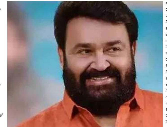
నామినేట్ చేసినందుకు మోదీకి ధన్యవాదాలు తెలిపారు. ఈ వేరకు పోస్ట్ పెట్టారు. హెర్బీ ఇండియాను నిర్మించాలంటూ.. మోహన్ లాల్ కూడా 10 మంది సీని ప్రముఖులను నామినేట్ చేశారు. "ఒకటి నమస్కారం ఉద్దేశ్యానికి నాయకత్వం వహిస్తున్నందుకు ధన్యవాదాలు మోడీ. ఇలాంటి ఆలోచనలతో ఆరోగ్యవంతులైన భారతదేశాన్ని రూపొందించగలం. నూనె వినియోగాన్ని తగ్గించడం వల్ల మార్పు రావచ్చు. ఈ మిషన్ లో చేతులు కలిపేందుకు నేనూ 10 మంది నామినేట్ చేస్తున్నా కలిసికట్టుగా ఉందా.. ఆరోగ్యవంతులైన భారతదేశాన్ని నిర్మించాం" అంటూ హీరోలు చిరంజీవి రజనీకాంత్ ముమ్మడి దుల్లర్ సల్మాన్, ఉన్ని ముకుందన్, టోవినో థాపూస్, హీరోయిన్లు మంజు వారియర్, కల్పాణి ప్రియదర్శన్, దర్శకుడు రవి, ప్రియదర్శన్ లను కూడా మోహన్ లాల్ నామినేట్ చేశారు.

దేశంలో ఊబకాయం సమస్యను అధిగమించేందుకు చర్యలు చేపట్టాలని ప్రధాని నరేంద్ర మోదీ పిలుపునిచ్చిన విషయం తెలిసిందే. ఒకటి నమస్కార గురించి ప్రధాని మోదీ ఆదివారం 'మన కీ బాత్'లో ప్రస్తావించారు. "2022లో ప్రపంచ ఆరోగ్యసంస్థ ఇచ్చిన గణాంకాల ప్రకారం.. ప్రపంచవ్యాప్తంగా 250 కోట్ల మంది అధిక బరువుతో బాధ పడుతున్నారు. ప్రతి ఎనిమిది మందిలో ఒకరు ఊబకాయం సమస్యను ఎదుర్కొంటున్నారు. ఇది చాలా ఆందోళనకర అంశం. దీన్ని అధిగమించేందుకు మనమంతా కృషి చేయాలి. అది మన బాధ్యత. తినే ఆహారంలో పంటనూనె వాడకాన్ని కనీసం పది శాతం మేర తగ్గించుకోవాలి" అని ప్రధాని పిలుపునిచ్చారు. దీనిపై ప్రజలకు అవగాహన కల్పించాలంటూ పది మంది ప్రముఖులను మోదీ నామినేట్ చేశారు. వారిలో అగ్ర కథానాయకుడు మోహన్ లాల్ పేరు ఉండడంతో తాజాగా ఆయన స్పందించారు. తన పేరును