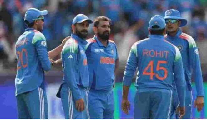
మైకేల్ అథర్టన్, నాజీర్ హుస్సేన్ అభిప్రాయపడ్డారు. ఛాంపియన్స్ ట్రోఫీలో పాల్గొనే జట్లన్నీ రకరకాల వేదికల్లో ఆడుతున్నాయి. మ్యాచ్ ల మధ్యలో ప్రయాణాలు చేయాల్సి

ప్రస్తుతం జరుగుతున్న ఛాంపియన్స్ ట్రోఫీ టీమిండియా దూకుడు ప్రదర్శిస్తోంది. ఇప్పటివరకు జరిగిన రెండు మ్యాచ్ లోనూ విజయం సాధించి సత్తా చాటింది. బంగ్లాదేశ్ తోనూ, పాకిస్తాన్ తోనూ జరిగిన మ్యాచ్ లో గెలుపొందింది. ఈ రెండు మ్యాచ్ లూ దుబాయ్ జరిగాయి. ఛాంపియన్స్ ట్రోఫీ పాకిస్తాన్ జరుగుతుండగా, భద్రతా కారణాల రీత్యా ఆ దేశానికి వెళ్లడానికి టీమిండియా సిద్ధపడలేదు. దీంతో భారత్ ఆడే మ్యాచ్ లను దుబాయ్ లో నిర్వహిస్తున్నారు. భారత్ ఆడే మ్యాచ్ లన్నీ దుబాయ్ వేదికగానే జరుగుతాయి. ఇదే టీమిండియాకు అన్యాయం అని పలువురు క్రికెటర్లు వ్యాఖ్యానిస్తున్నారు. ఛాంపియన్స్ ట్రోఫీలో టీమిండియా ఒకే వేదికలో మ్యాచ్ లు ఆడుతుండడం కచ్చితంగా ఆ జట్టుకు కలిసొస్తుందని ఆస్ట్రేలియా ఆటగాడు ప్యాట్ కమిన్స్ ఇంగ్లండ్ మాజీ ఆటగాళ్లు